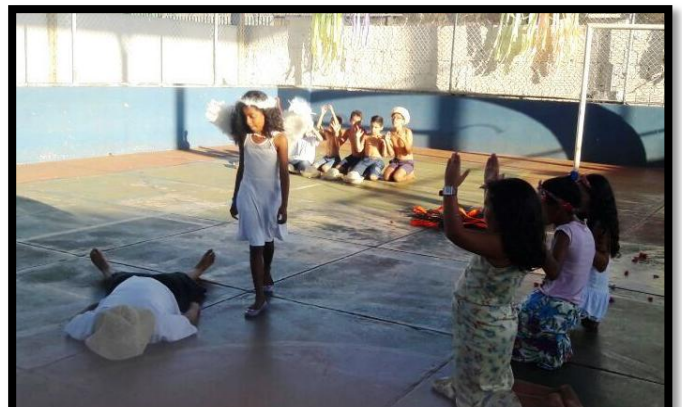
Grupo de capoeira composto por alunos do projeto encenam teatro sobre a História da Capoeira e africanidades