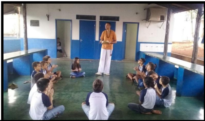
Crianças e adolescentes compreendem a função e a história da Roda de Capoeira