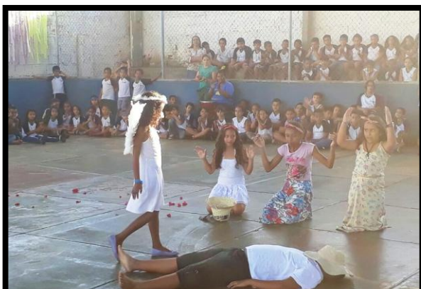
Comunidade escolar prestigiando grupo de capoeira do projeto na encenação de teatro que contou a origem da capoeira no Brasil