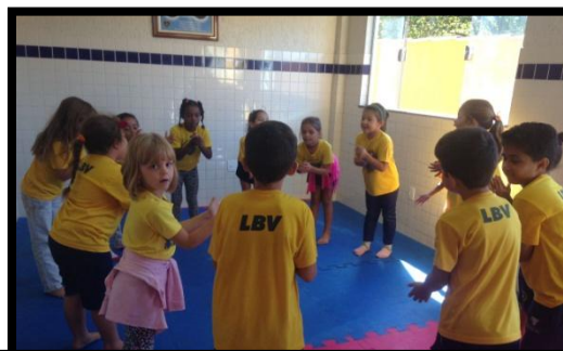
Dinâmica trabalhou com crianças o fortalecimento da confiança e trabalho em grupo