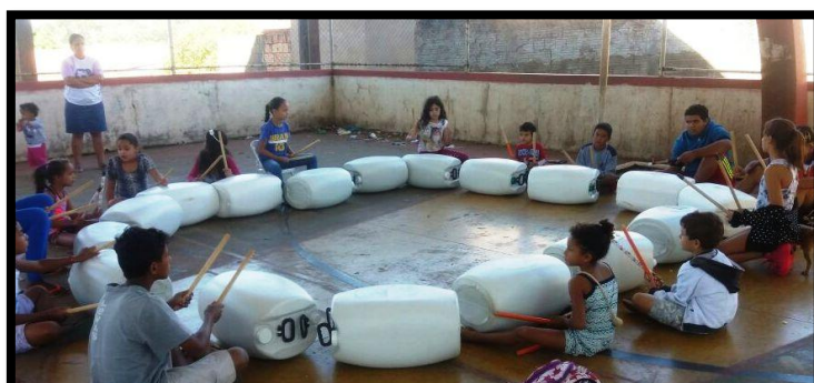
Adolescentes e crianças concentram-se no aprendizado do ritmo da percussão