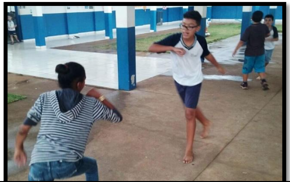
Adolescentes treinando movimentos da ginga em pares