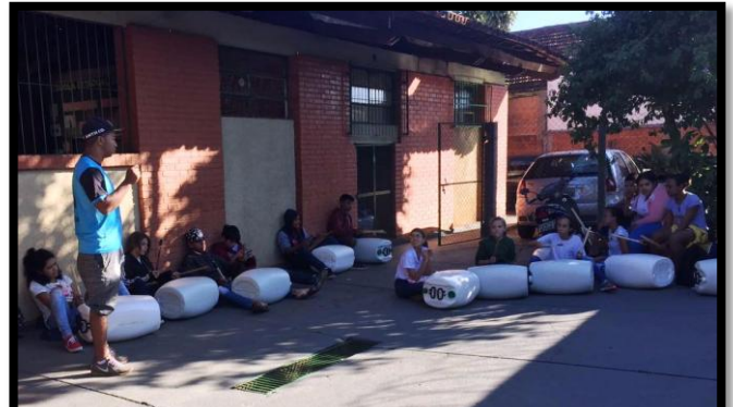
Grupo aprende novo ritmo