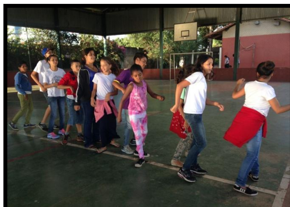
Adolescentes mesclam ritmos regionalistas com dança de rua