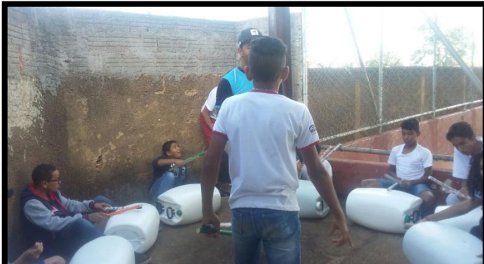
Adolescente propondo ritmo aos colegas