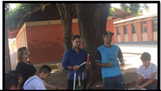
Arte-Educador de percussão conta sobre a história da percussão no Brasil