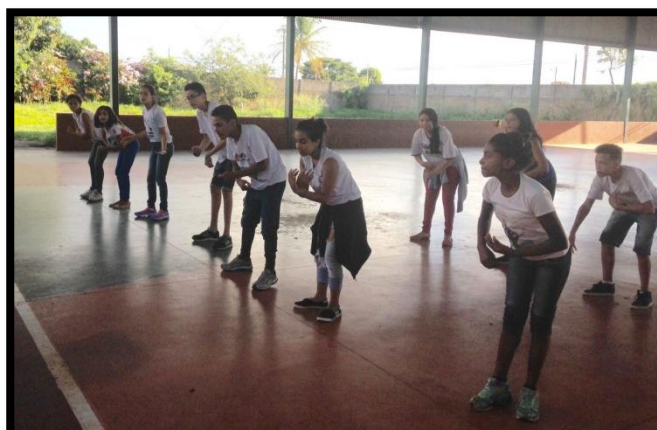
Adolescentes fazem criação de movimentos e coreografia