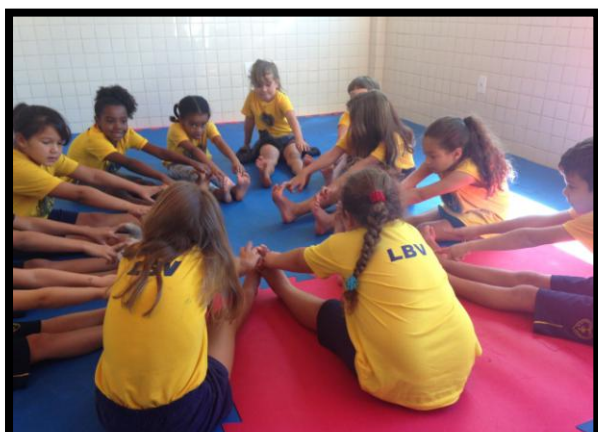
Crianças aprendem o processo de alongamento e aquecimento para iniciar a prática da dança