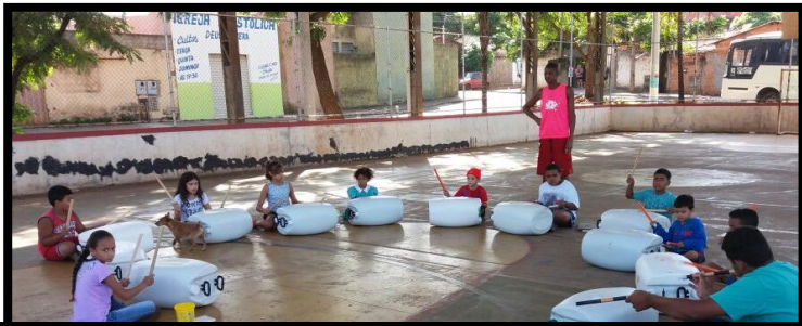
Crianças durante atividade de musicalização com o foco na introdução prática ao ritmo proposto