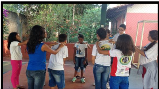
Adolescentes em atividade de relaxamento, sensibilização e "contato respeitoso com o outro"