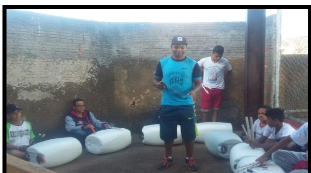
Adolescentes recebem instruções sobre a utilização dos instrumentos e primeiras noções de ritmos na percussão

Nesta modalidade as crianças, adolescentes e jovens das escolas públicas e instituições comunitárias vivenciarão o reconhecimento das histórias, da literatura oral, dos espaços de cultura regional na cidade de Uberaba e região que ainda valorizam o aprendizado das produções e produtos essencialmente folclóricos-regionais. O professor trabalhará junto ao público momentos em que entenderão como a cultura regional tem afetado diretamente as construções cotidianas, bem como influenciado a formação do imaginário cultural ao longo dos anos.