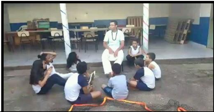
Crianças e adolescentes aprendem músicas tradicionais de roda de capoeira