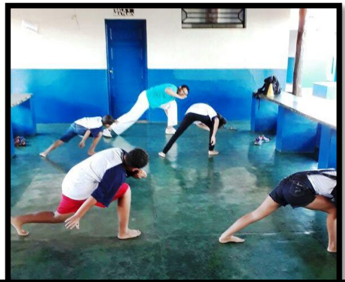
Crianças e adolescentes reconhecem os primeiros passos da Ginga