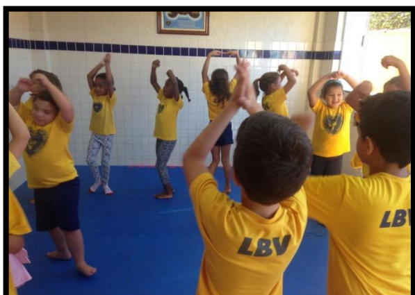
Crianças criam passos de dança unindo passos de balé aos ritmos afro

Nesta modalidade as crianças, adolescentes e jovens das escolas públicas e instituições comunitárias terão acesso a diferentes tipos de músicas e danças típicas do regionalismo e da cultura afro-brasileira. O professor estimulará através de danças afro-brasileiras o desenvolvimento cognitivo e a importância de se reconhecer o corpo e a leveza artística do ato de dançar. Ainda apresentará novos estilos musicais resgatando e valorizando as produções típicas do território nacional.